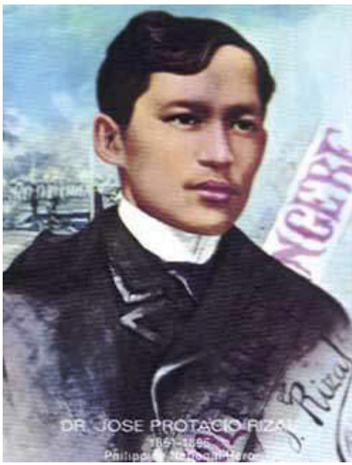
Jose Rizal